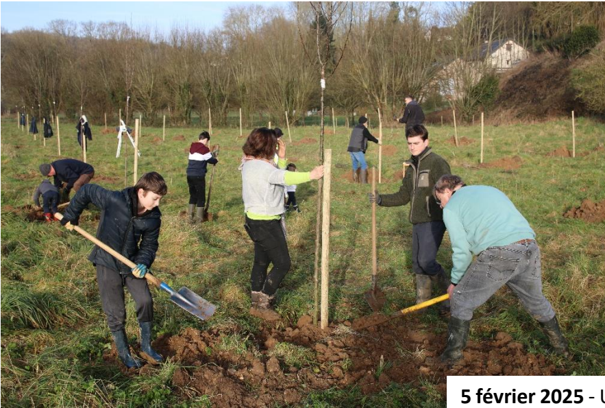
5 février 2025 - Un chantier participatif a réuni petits et grands pour la plantation des arbres fruitiers du verger au Mont Rôty.